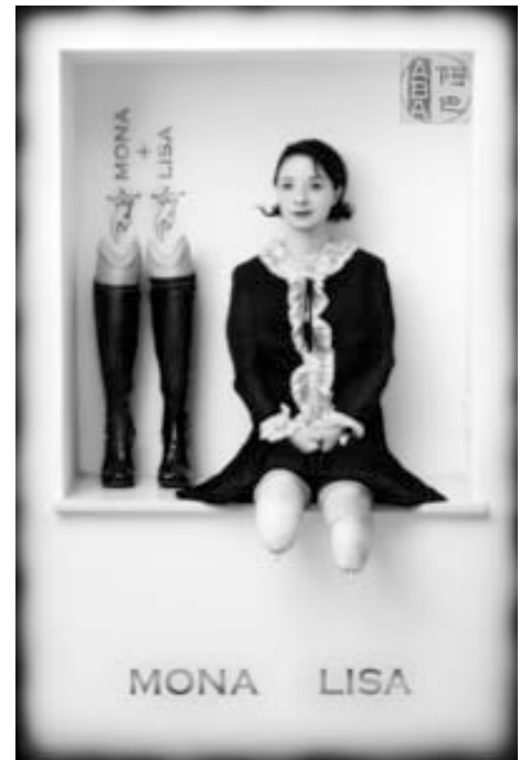
« The Charm of Harm » de Gerald Teufel (Austria)