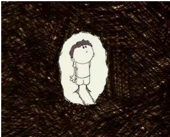
« Mon petit frère de la Lune » de Frédéric Philibert (France)