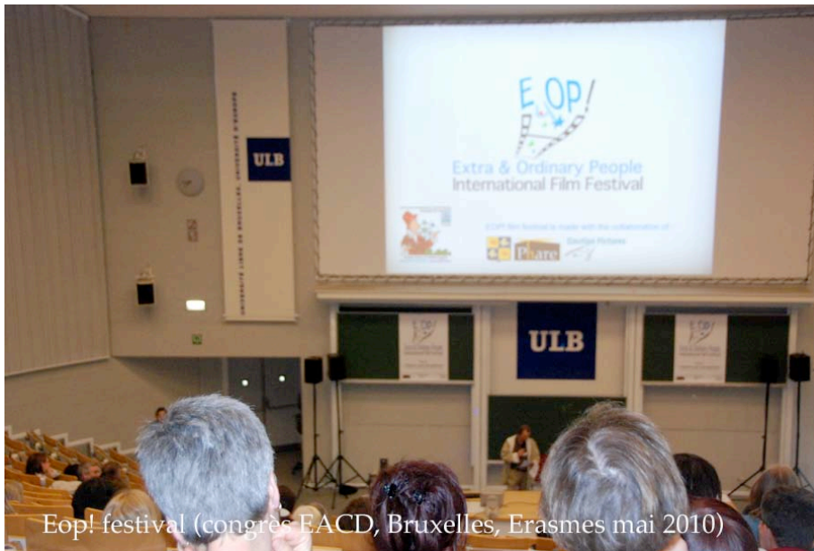
Eop! festival (congrès EACD, Bruxelles, Erasmes mai 2010)