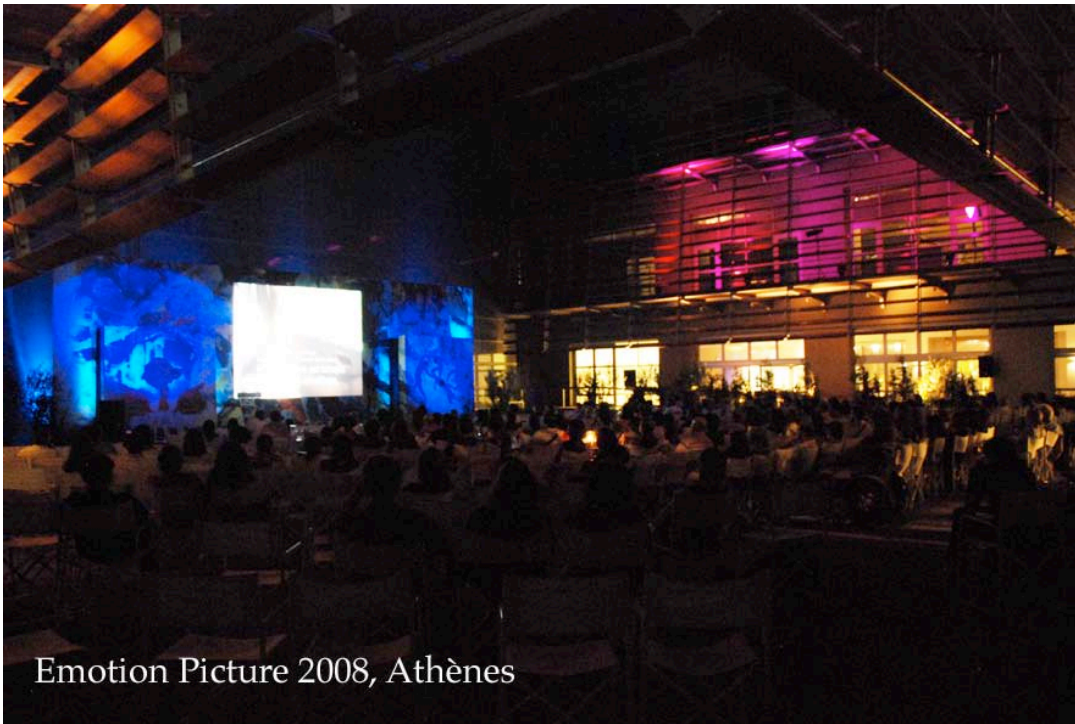
Emotion Picture 2008, Athènes