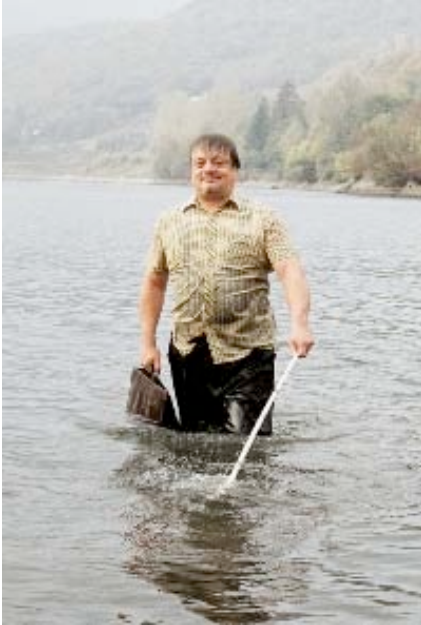
« Blind Loves » de Juraj Lehotsky (Slovakia)