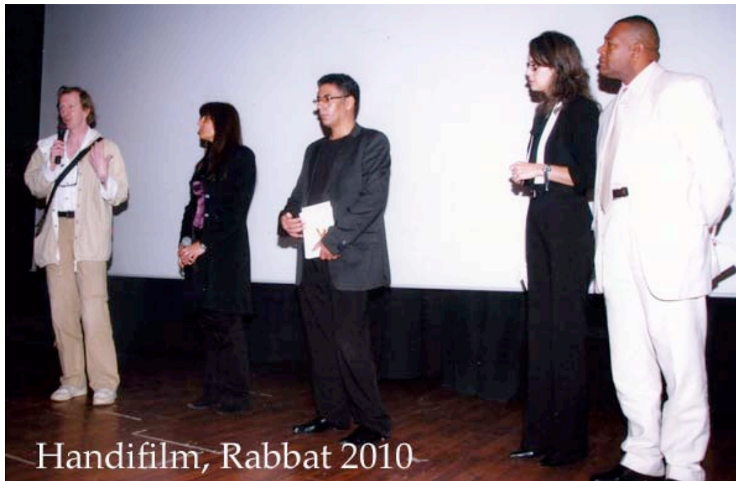
Handifilm, Rabbat 2010